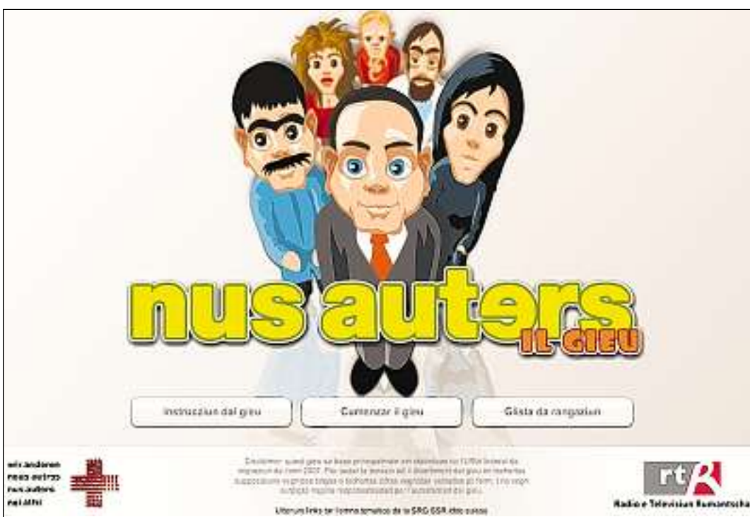
Pagina d'entrada dal giu.

Sco interpredider po il giugader plazzar las lavurantas ed ils lavurants disponibels sin il martgà da lavur a moda uschè ideala sco pussaivel en ils secturs economic. El po spustar il persunal d'in sector a l'auter u relaschar las persunas tut tenor il svilup economic. El sto adina empruvar da reparter las persunas tenor lur abilitads e cuntanscher ina relaziun armonica tranter ils indigens ed ils immigrants. La finala po el era influenzar il nivel da las pajas en ils