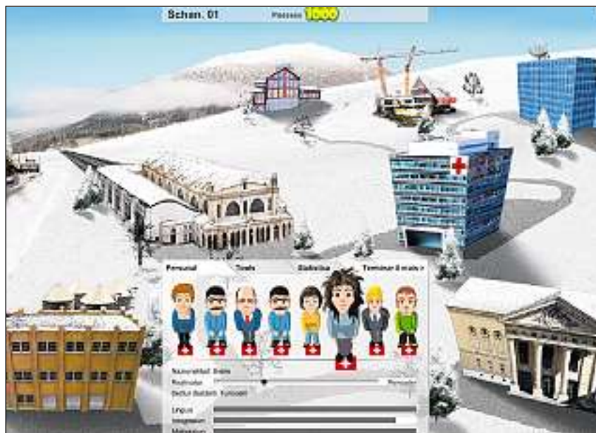
Ils lavurers ed ils differents secturs da lavur.